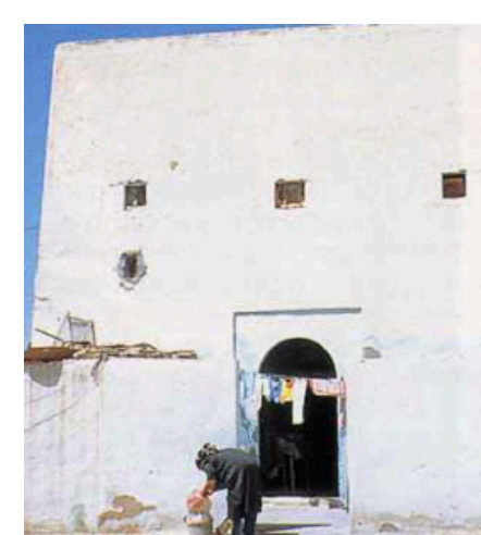
Habitat semi-rural de Sfax (N. Bakiouti)