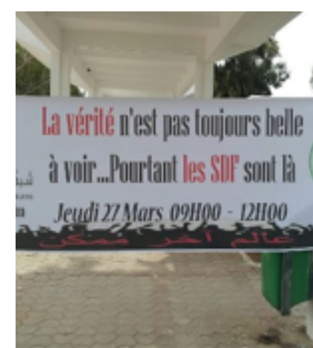
Indifférence face aux SDF (Flamme d'Afrique)