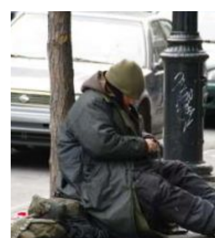
Mal logement à Tunis (Tap Info)