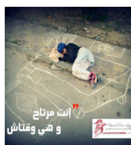
Image pour les Assises du Logement décent