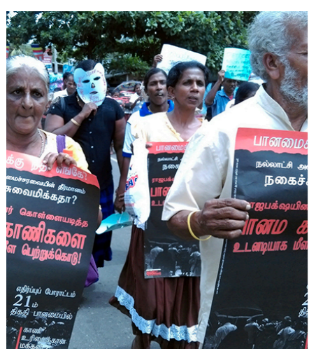
Sri Lanka Brief