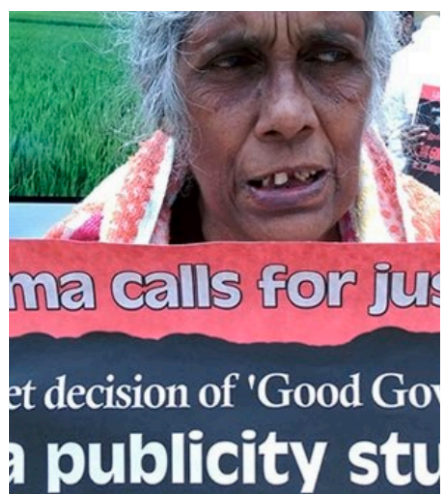
Sri Lanka Brief