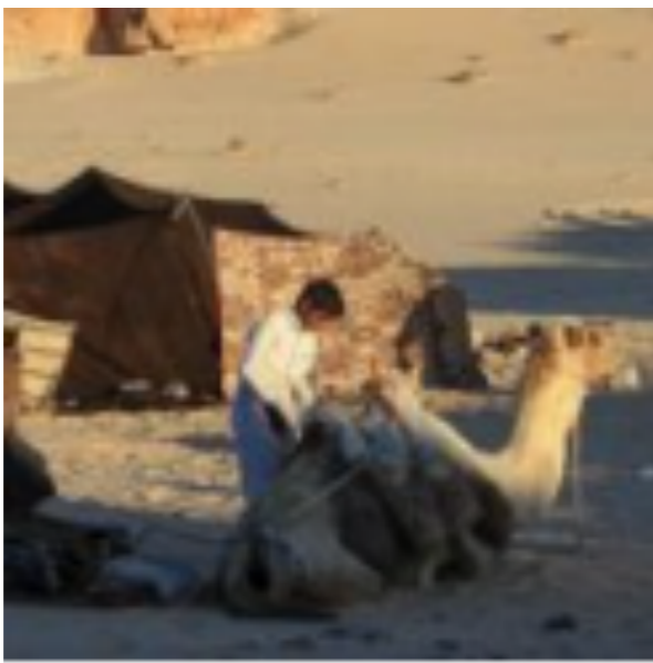
Les tentes des Bédouins

Dans la périphérie de Damas, des centaines de familles s'entassent dans des immeubles en construction qui s'alignent le long de rues boueuses jonchées d'ordures. Les portes et fenêtres, encore béantes, sont colmatées à l'aide de bâches en plastique ou de cartons pour empêcher les courants d'air.