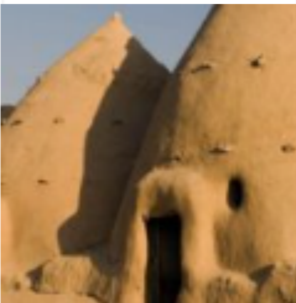
Les maisons traditionnelles en Syrie