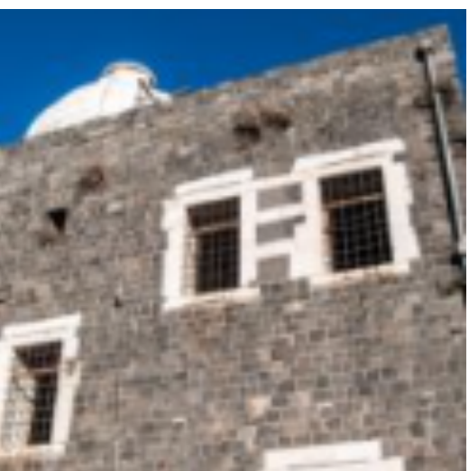
Les vieilles maisons de Homs

Les maisons traditionnelles des villes anciennes de Damas, d'Alep et des autres villes syriennes sont bien conservées, mais beaucoup d'entre elles ont été sérieusement endommagées par les combats de ces dernières années. Traditionnellement, les quartiers d'habitation sont disposés autour d'une ou plusieurs cours, généralement avec une fontaine au milieu alimentée par l'eau de source et décorée d'agrumes, de raisin de vignes et de fleurs aménagées pour le confort de la famille et des invités. Dans les villages, les maisons syriennes présentent un front fermé au monde extérieur, symbolisant l'unité familiale autonome.