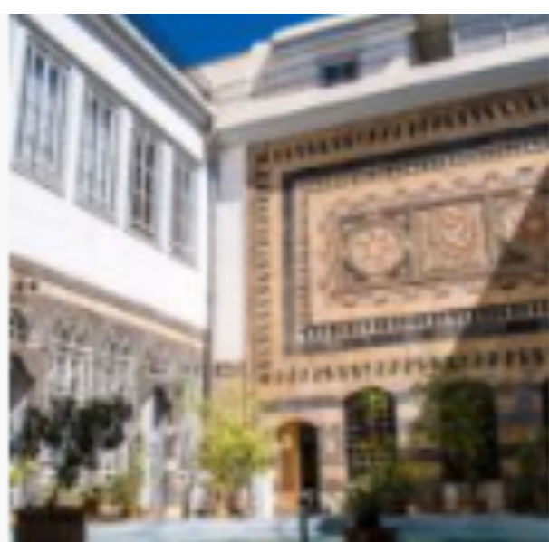
Beit al-Aqad : maison traditionnelle de Damas