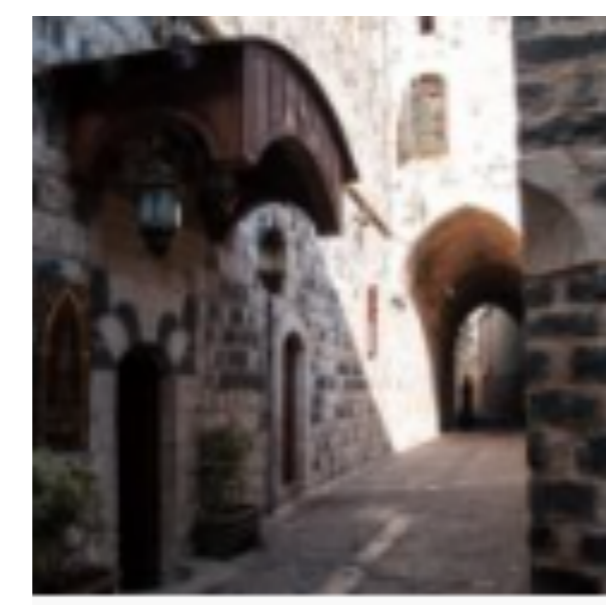
Les vieilles maisons de Hama