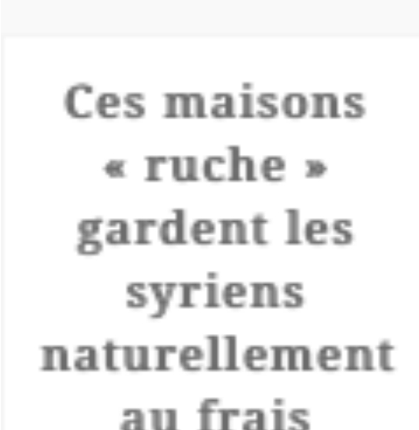
Ces maisons « ruche » gardent les syriens naturellement au frais depuis des siècles