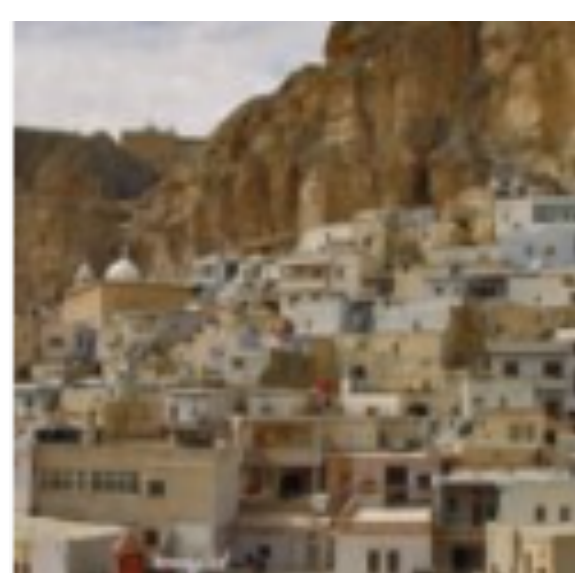
Les maisons traditionnelles en Syrie