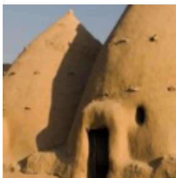
Ces maisons « ruche » gardent les syriens naturellement au frais depuis des siècles