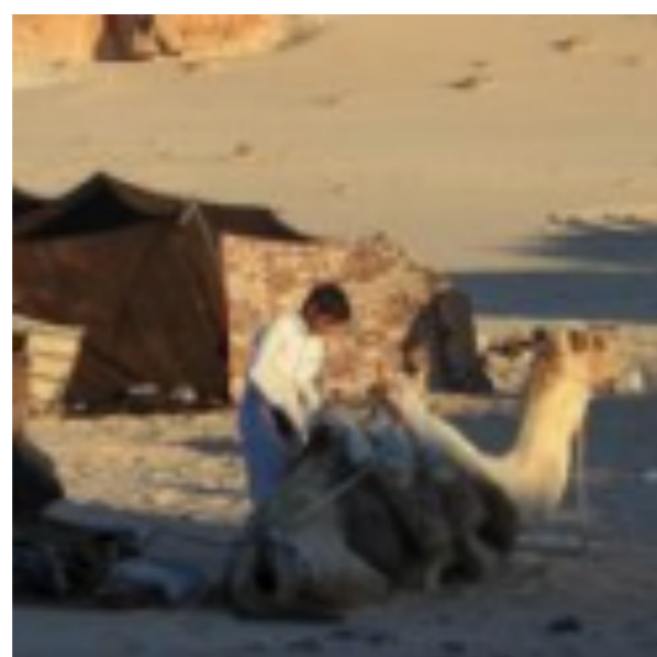
Les tentes des Bédouins