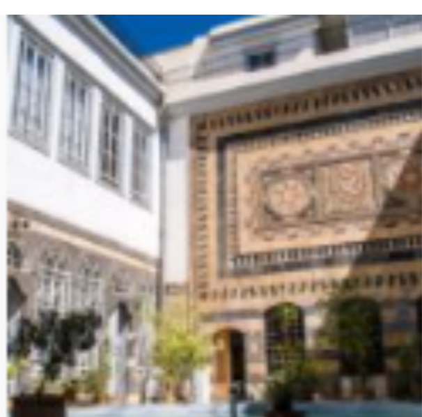
Beit al-Aqad : maison traditionnelle de Damas