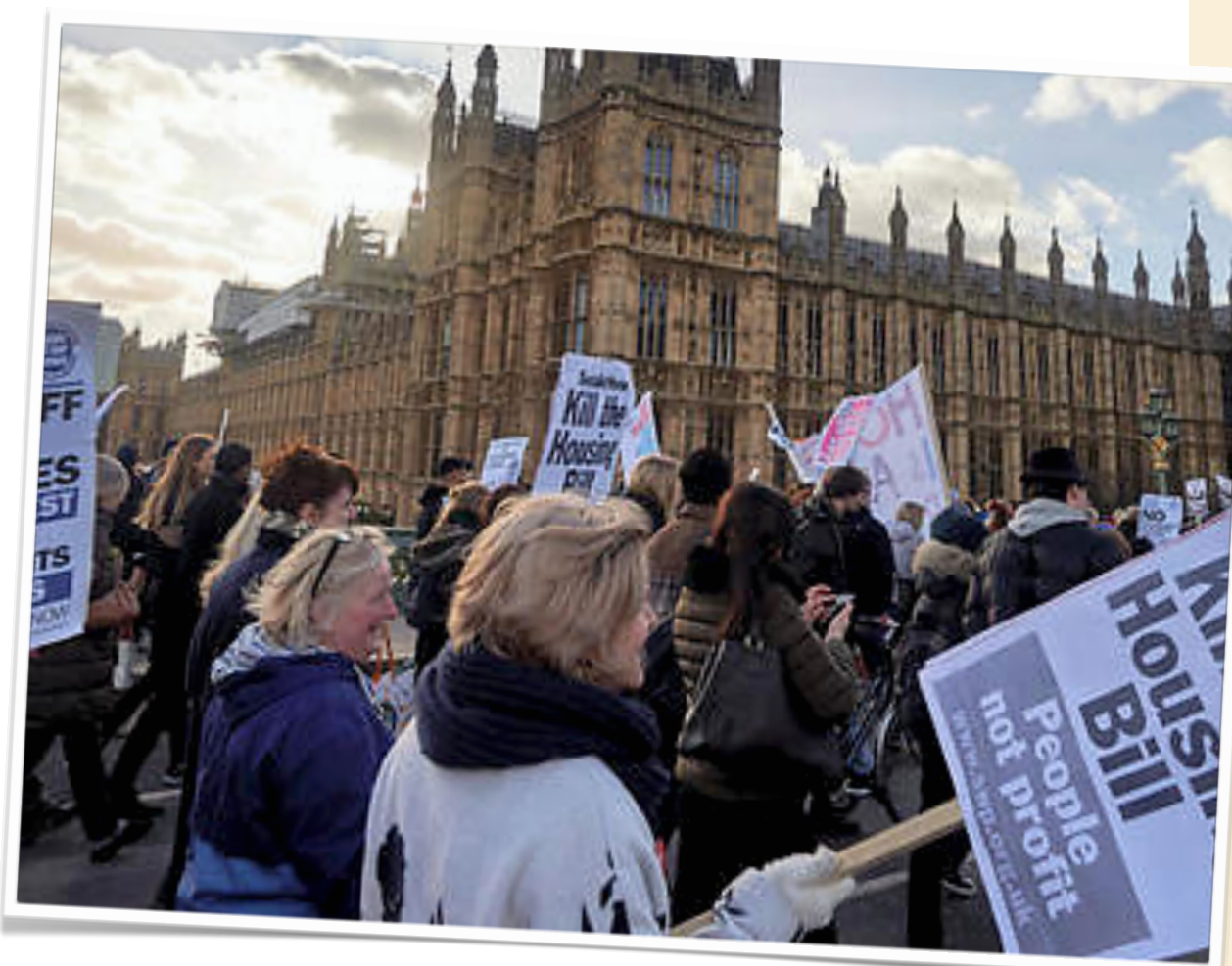
Manifestación en Londres