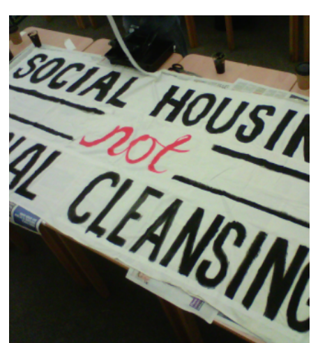
Radical Housing Network