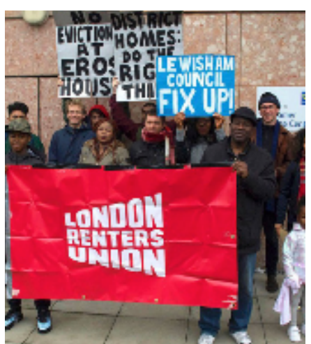
Radical Housing Network