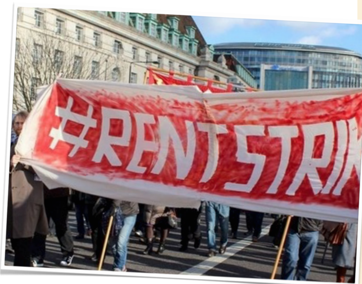
Huelga de alquileres - Londres - 2016