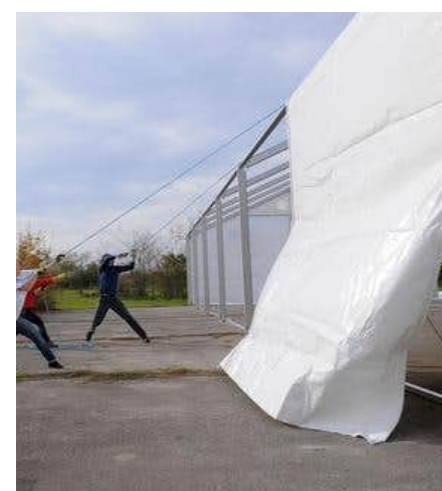
Médicos sin fronteras en campos de refugiados en Eslovenia