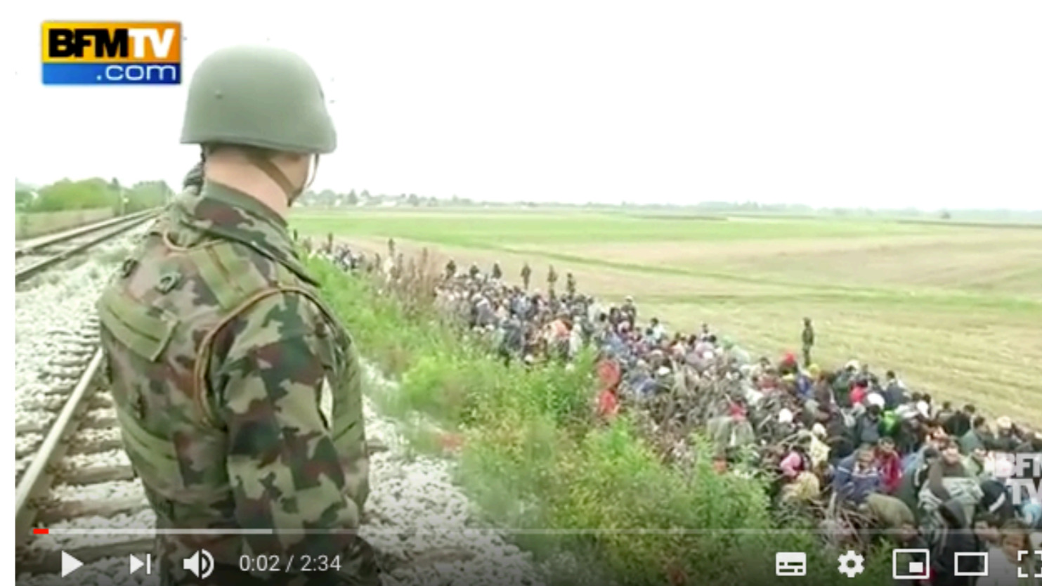
Reportage dans un camp de migrants en Slovénie

Fuentes: CETIM - publicación COHRE & Housing Rights Watch